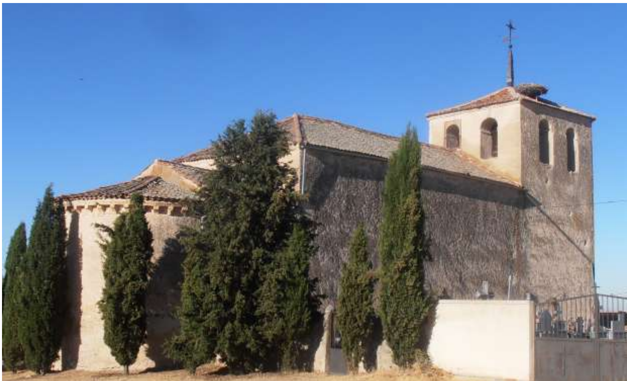
Fig. 9. Ábside, muro norte y torre de la iglesia de Villovela.

La iglesia de Villovela es uno de los muchos edificios románicos de la comarca del río Pirón. La iglesia está consagrada a Nuestra Señora de las Candelas y es una construcción del siglo XIII. Es un edificio de nave única con ábside semicircular y en él se debe destacar la portada, orientada hacia el sur; esta portada está formada por tres arquivoltas, siendo las dos exteriores baquetones semicirculares con decoración de puntas de diamante y con una banda ajedrezada de remate al exterior; los dos capiteles tienen decoración animal bastante deteriorada, entre la que se reconocerían arpías; la línea de impostas se decora con una banda con elementos florales.