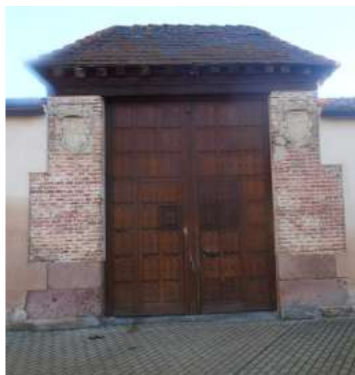
Fig. 5 y 6. Fachadas de la iglesia de San Zoilo y de casona blasonada, Escalona del Prado.

Saliendo hacia la carretera SG-V- 2213, torcemos a nuestra derecha, para inmediatamente después girar por la calle Honda (la primera que encontramos a nuestra izquierda), calle que se prolonga hasta un camino que conduce hasta Turégano; este camino tiene firme asfaltado en su primer tramo y tras recorrer 300 metros por este camino asfaltado, seguimos recto por un camino de tierra y tras realizar algo más de un kilómetro desde que dejamos atrás la plaza de Escalona cogemos el camino que sale a nuestra derecha, entre una nave ganadera y el lavajo representado en el mapa en el paraje nombrado como Navagrande; recorriendo dos kilómetros por este camino, y dejando a nuestra izquierda el alto Otonrubio con su ladera surcada por cárcavas, subimos la pendiente de otro alto en el que haremos una nueva parada; tras ascender una rampa muy pronunciada hay un descansillo en el que nos bajaremos de la bici y