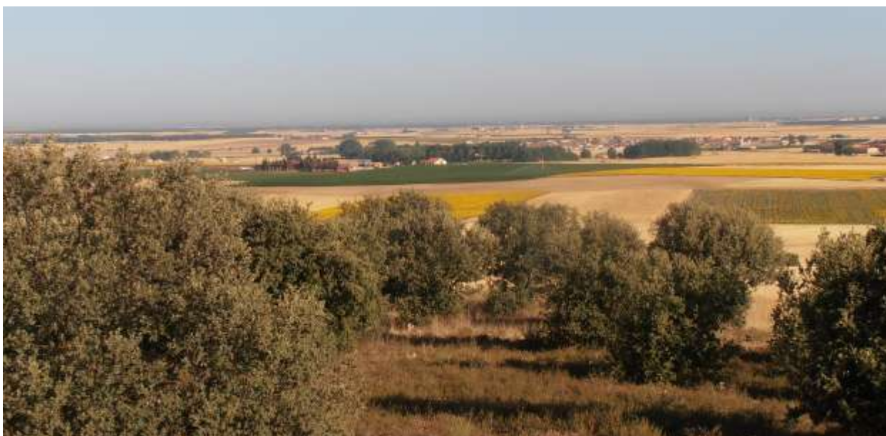
Fig. 8. Vista desde el otón del Monte. El caserío de Escalona en segundo plano.

Estos cerros de las campiñas sobresalen sobre un relieve suavemente ondulado. Desde el alto se tienen unas vistas excelentes de la campiña, de la Sierra al sur y la mancha verde de Tierra de Pinares al norte. El nombre que reciben estos cerros es de otones o montones, en relación a elevaciones poco importantes, que a modo de cerros testigo son elementos residuales de una superficie más o menos llana que fue erosionada durante miles de años, fundamentalmente debida a la acción del agua en arroyada. La palabra “otón” parece proceder del latín con el sentido diminutivo de “alto” y tiene la misma raíz que el término “otero”; el propio nombre del pueblo de Otones hace referencia a la proliferación a su alrededor de esa forma de relieve.