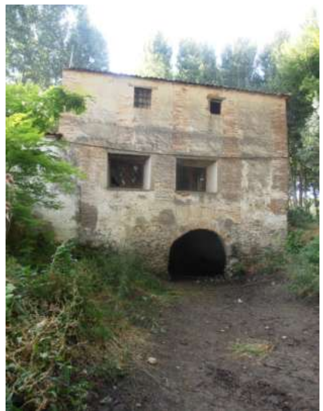
Fig. 18 y 19. Presa y fachada posterior del molino del Lago.