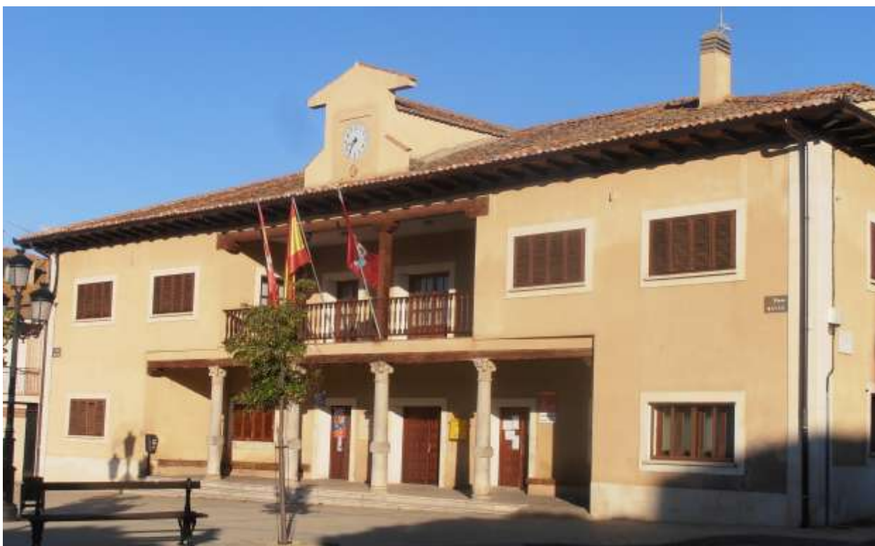
Fig. 4. Ayuntamiento de Escalona del Prado.

ayuntamiento tiene su réplica en el pórtico de la iglesia parroquial, pero con cinco columnas sobre plinto; el cuerpo de la iglesia es del barroco tardío( siglo XVIII), con planta de cruz latina , realizada en mampostería revocada, con refuerzos de ladrillo visto al exterior en ángulos, contrafuertes, vanos de las ventanas y en los aleros semicirculares; la torre campanario, más antigua, tiene tres cuerpos y un zócalo retranqueados y está realizada en piedra caliza bien escuadrada; frente a la iglesia, una fachada blasonada con escudos a ambos lados de un portón que da paso a un patio tras el que se encuentra la casa-palacio.