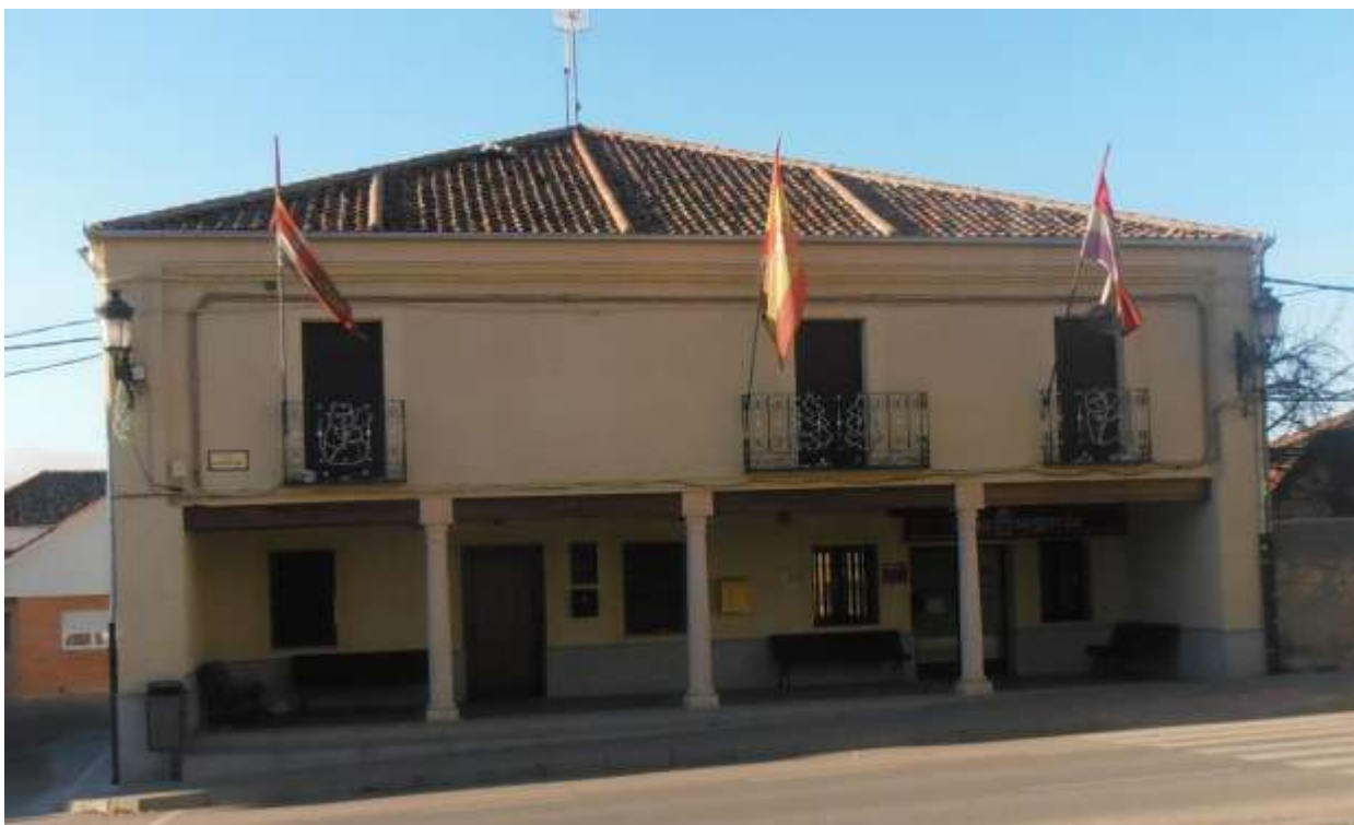
Fig. 1. Ayuntamiento de Aldea Real.

El espacio de la Plaza Mayor es muy amplio, y en él nos encontramos una fuente, columpios y una zona ajardinada. Separados por la carretera tenemos dos edificios porticados: el ayuntamiento y la iglesia. El edificio más destacado es la iglesia de San Juan Bautista, que se levanta en el punto más elevado del casco urbano; es de origen románico y de su antigua fábrica se conserva la torre campanario y, posiblemente, la portada del pórtico con triple arcada de ladrillo; el cuerpo del edificio fue ampliado en el siglo XVI, en estilo gótico tardío, visible en las bóvedas de terceletes de su interior; como curiosidad, se puede destacar que es una de las pocas iglesias que tiene dos naves, separadas éstas por grandes arcos de medio punto. A lo largo del pueblo podemos ver numerosas casas de tipología tradicional semejantes a las mencionadas en el recorrido por Pinarnegrillo.