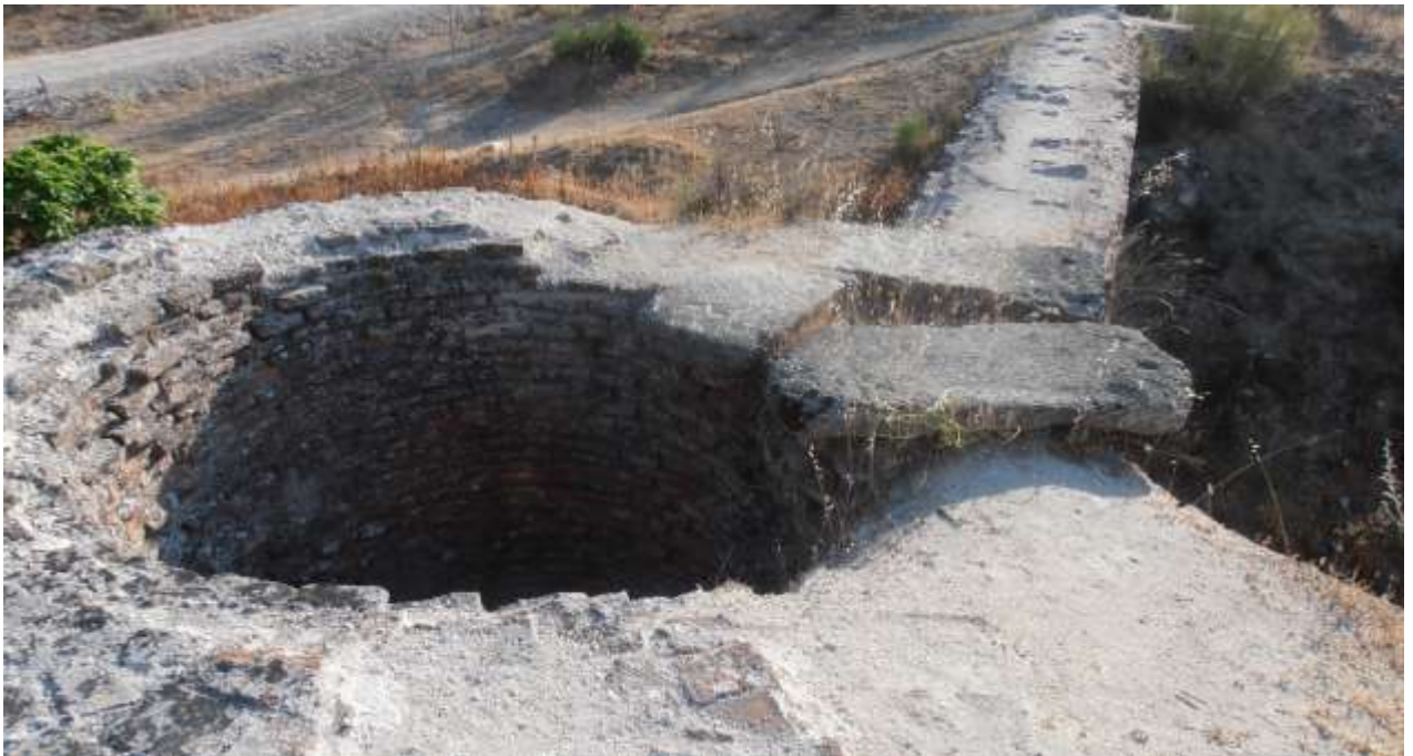
Fig. 14. Ruinas del cubo y del muro del canal que llevaba el agua al molino. Arroyomolinos (Madrid)

Entre otros lugares, podemos encontrar este molinos de cubo en Villandiego (Burgos) , en Villadepera de Sayago (Zamora), en Navagamella (Madrid) y hubo uno en la Casa de Compañía, en las proximidades del monasterio de El Escorial. Esta tipo de molinos estaba indicado para lugares con caudal escaso e irregular.