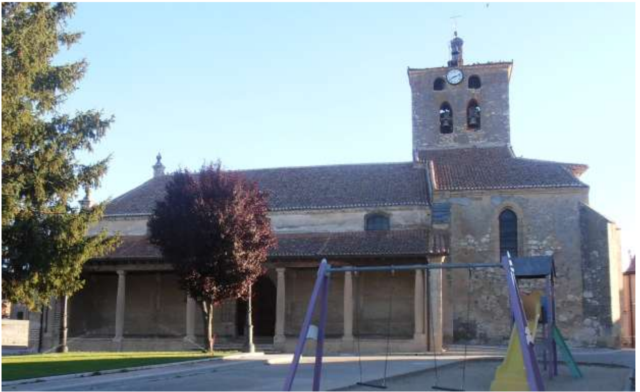
Fig. 2. Iglesia de San Juan Bautista, Aldea Real.

Por el lado norte de la iglesia discurre la carretera que nos llevará hasta Escalona del Prado, con un firme poco recomendable para ir en coche, pero los baches no son mayor inconveniente para la bicicleta. Tras recorrer unos 3,5 kilómetros por esta carretera llegamos a unas naves ganaderas a uno y otro lado, tras las cuales encontramos un cruce de carretera en el que nos desviamos a la derecha hasta llegar al cementerio y a la ermita de la Virgen de la Cruz, lugar donde, según la leyenda, se apareció la Virgen a una joven de Escalona. Girando 90° a la izquierda y a unos 300 metros de la ermita haremos la segunda parada en el centro del pueblo.