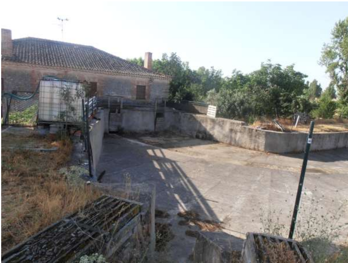
Fig. 12. Presa y molino del Cubo

Este edificio está habitado por el último molinero que allí trabajó. Un mastín ladrador nos advierte que allí no se puede pasar, por lo que nos conformaremos con verlo desde el camino. El caz paralelo al camino desviaba el agua desde el arroyo Polendos y lo conducía hasta la presa donde era retenida; las dos compuertas nos señalan que era un molino que podía trabajar con dos piedras (cuando molía, porque hace más de quince años que no pasa agua por ese cauce)