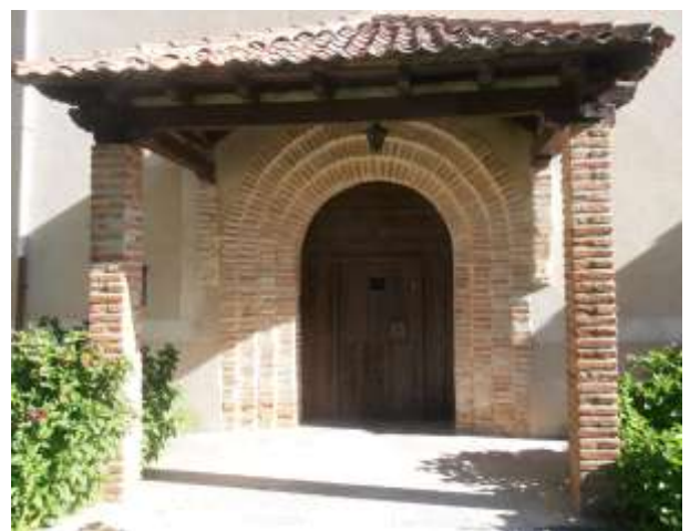
Fig. 16 y 17. Vista de la ermita de Rodelga y portada de su cara oeste.

Desandamos el camino asfaltado y tras 750 metros nos desviamos por el camino de tierra que sale a nuestra derecha antes de llegar al puente pequeño y que discurre paralelo al caz del río Pirón; recorriendo medio kilómetro por este camino llegaremos al molino del Lago donde realizamos la siguiente parada.