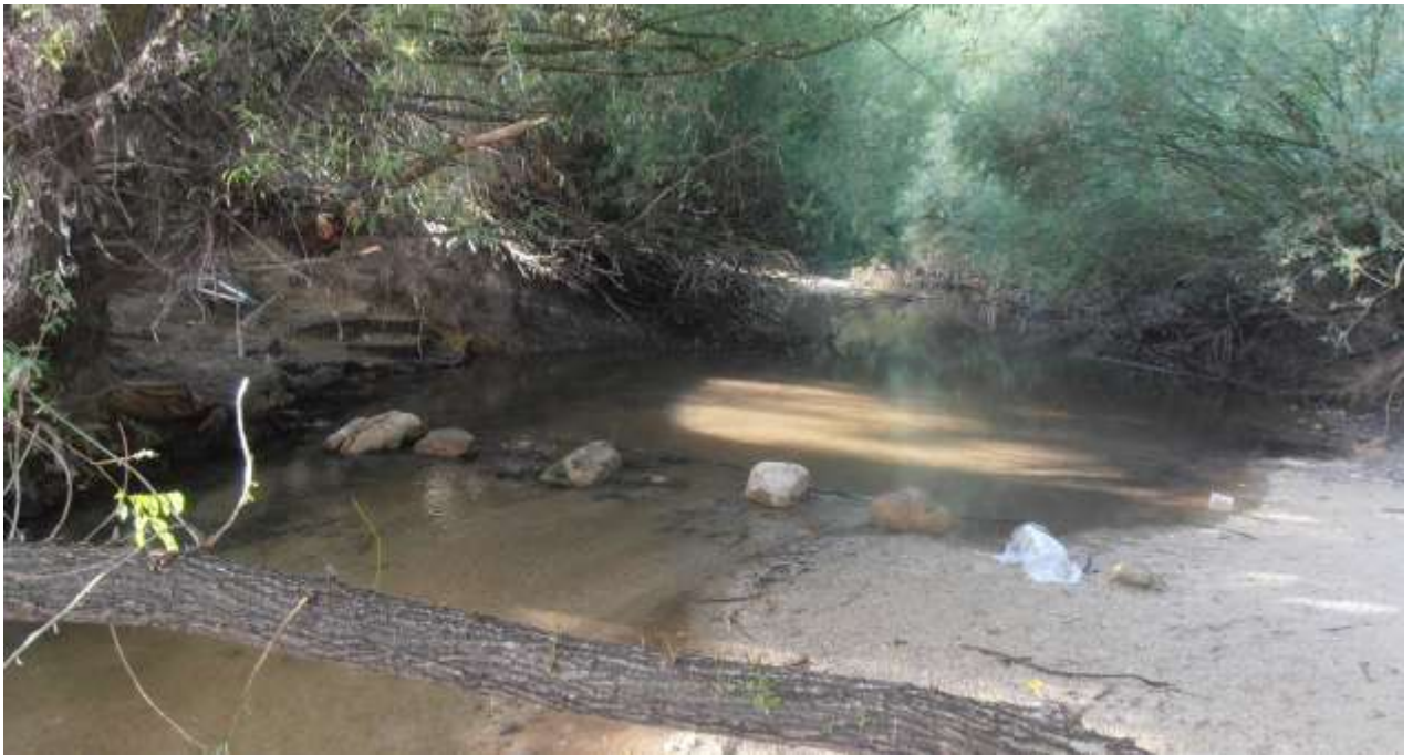
Fig. 15. Vado del río Pirón

Se propone un camino alternativo cuando el río lleva más agua y el paso sería muy dificultoso; tomaríamos el camino que sale a la izquierda a la altura del molino del Cubo y tendríamos que llegar hasta Mozoncillo ; llegando hasta las primeras casas nos desviaríamos hacia la derecha por un camino asfaltado que pasa por el llamado “puente de hierro” sobre el río Pirón y el “puente pequeño” sobre el caz de desvío hacia el molino del Lago y que nos llevará hasta la ermita de de Rodelga.