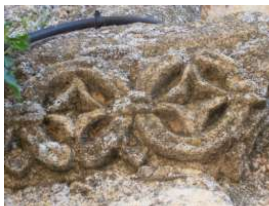
Fig. 10 y 11. Arcos de la portada y detalle de las rosetas de la línea de impostas, iglesia de Villovela.

Desde la explanada de la entrada de la iglesia pueden contemplarse hacia el sur los montes próximos, cubiertos de encinas y entre ellas aparece en la lejanía la ermita de la Virgen de la Octava de Peñarrubias, interesante construcción románica que se detallará en la ruta de Covatillas.