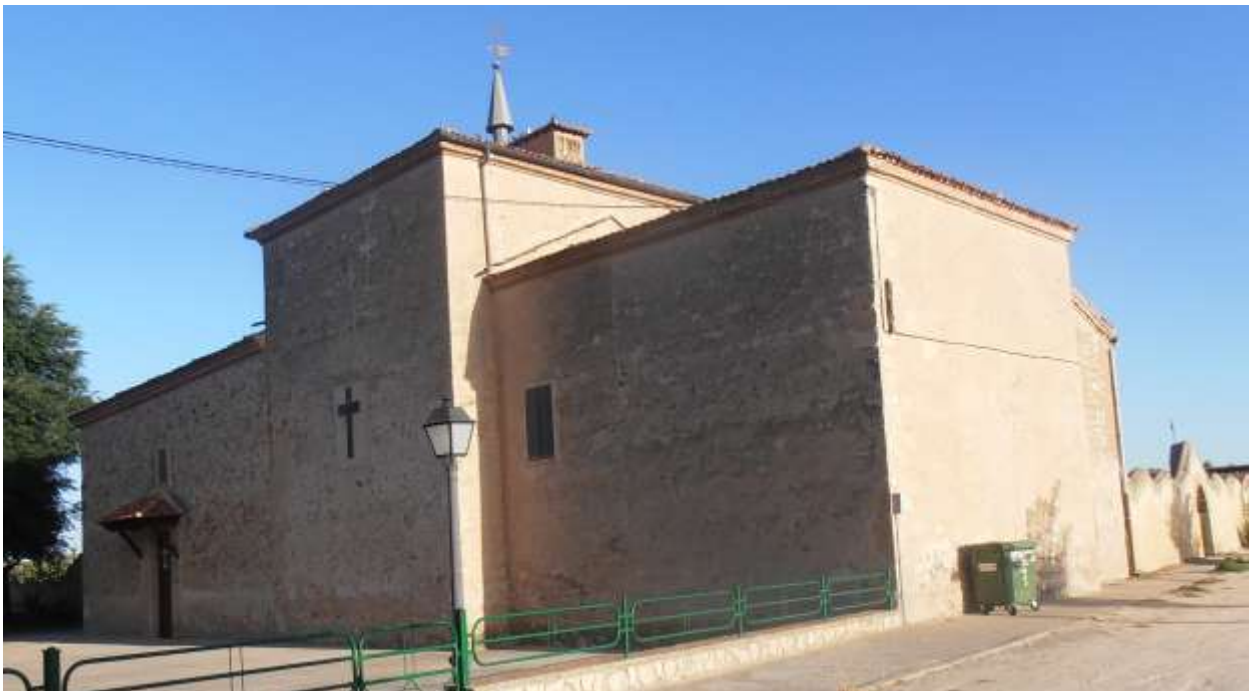
Fig. 3. Ermita de la Virgen de la Cruz, Escalona del Prado.

Por el lado norte de la iglesia discurre la carretera que nos llevará hasta Escalona del Prado, con un firme poco recomendable para ir en coche, pero los baches no son mayor inconveniente para la bicicleta. Tras recorrer unos 3,5 kilómetros por esta carretera llegamos a unas naves ganaderas a uno y otro lado, tras las cuales encontramos un cruce de carretera en el que nos desviamos a la derecha hasta llegar al cementerio y a la ermita de la Virgen de la Cruz, lugar donde, según la leyenda, se apareció la Virgen a una joven de Escalona. Girando 90° a la izquierda y a unos 300 metros de la ermita haremos la segunda parada en el centro del pueblo.