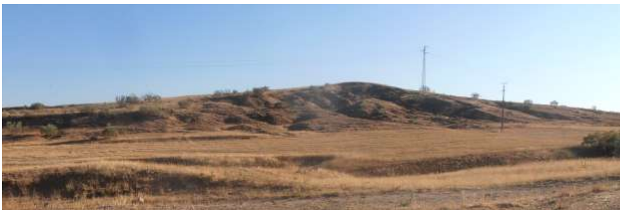
Fig. 7. Alto de Otonrubio

subir a pie los últimos 200 metros para llegar hasta el punto culminante del recorrido, a 963 metros de altitud.